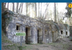
• Le poste de secours allemand (1914)