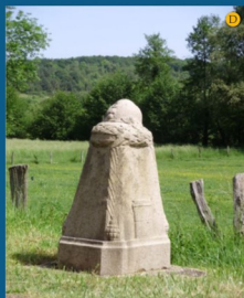
• La borne Moreau-Vauthier à la sortie du village (1928)