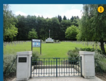
• La nécropole du Trottoir (1936)