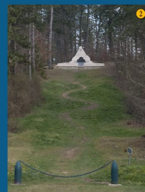
• Le monument du 106ème RI dit des Revenants (1935)