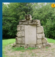
• Le monument du 302e R.I.