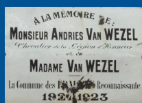
Plaque mémorielle à la mémoire du général bienfaiteur des Esparges (1923)