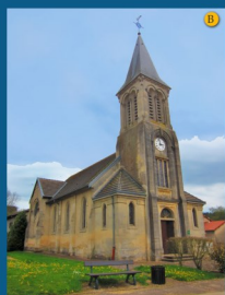
• L'église Saint Martin des Esparges (1929) et sa chapelle des ex-voto 1914-1918