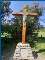
• Le orbi de Fiquaux (1938)