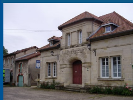
• La mairie (1929)