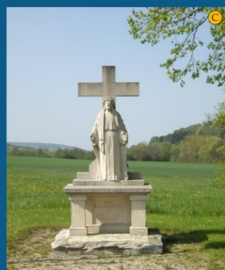
• Le calvaire en pierre réalisé par Dulio Donzelli (1931)