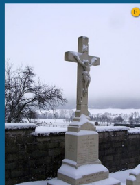
• L'ossuaire / monument aux morts dans le cimetière communal au pied du chemin de la relève (1924)