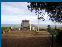
• Point de vue exceptionnel du Point X