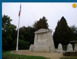
• Le monument du Point X réalisé par Mira Fischer, comtesse de Cugnac, en hommage « A ceux qui n'ont pas de tombe » (1925)