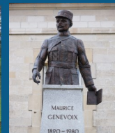
• Buste du lieutenant Maurice Genevoix (2015)